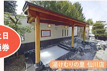
湯けむりの里 仙川店