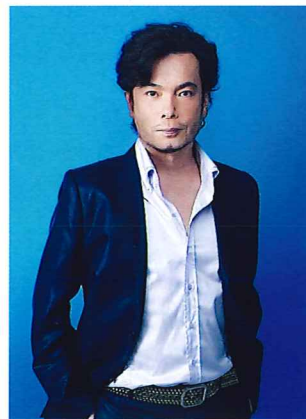
錦織 健 (テノール)