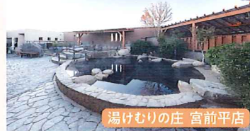
湯けむりの庄 宮前平店