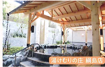
湯けむりの庄 網島店

【有効期限】 令和7年6月30日まで 【定員】 1会員につき5枚まで 【申込】1月16日(木)・17日(金) 10:00~15:00 【支払】1月29日(水)から事務局にお支払いください。