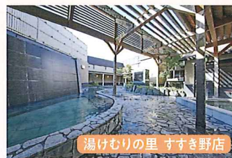
湯けむりの里 すずき野店